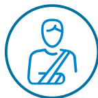
Ortopedia y traumatología