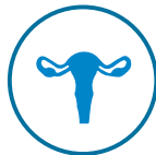
Ginecología y obstetricia